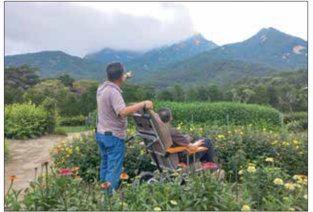
3년 투병 말기환자의 나들이