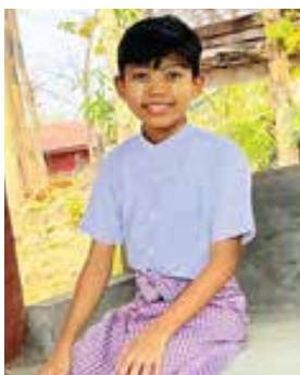
이 잘생긴 9살 아들을!