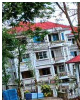
4층이 3층이 된 빌라 400동