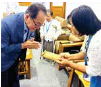
구호금 전달(아들 잃은 엄마)