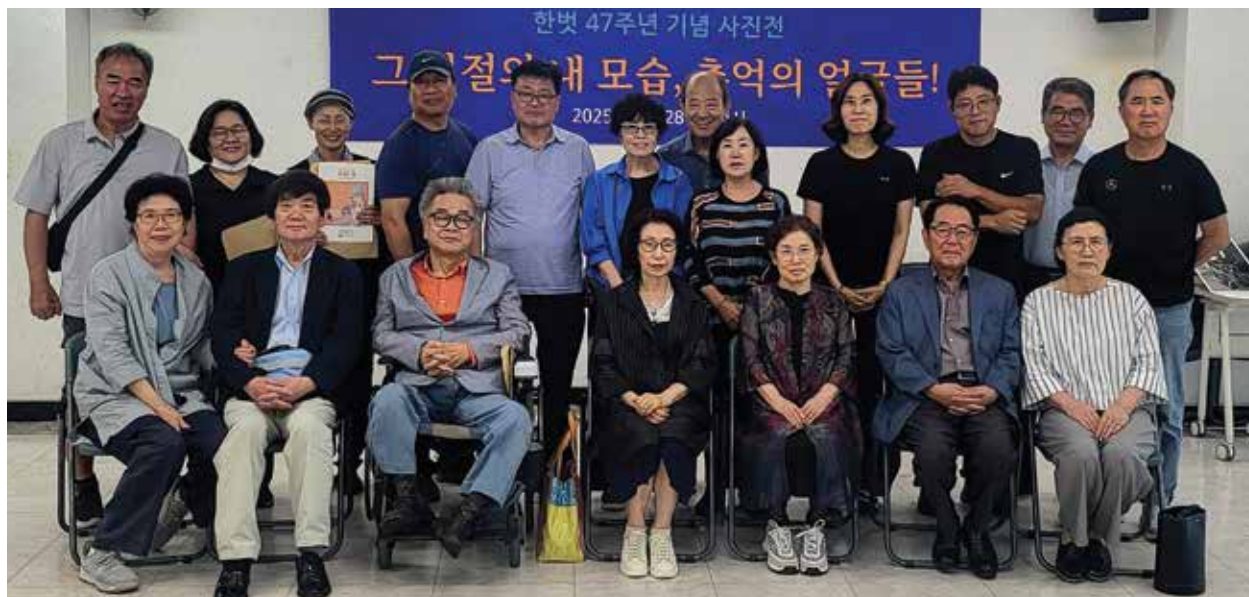
— 지난 시절의 얼굴 148명 사진 전시