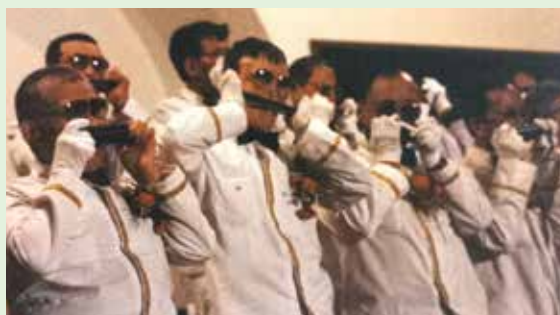
소록도 하모니카 합주단