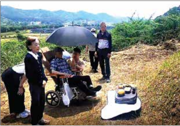
고향 전남 장성의 선친묘를 찾은 환자