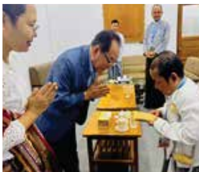
구호금 전달(장애인 가정)