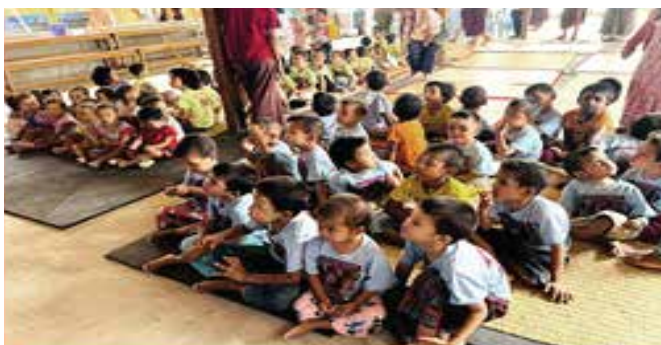
사가잉 지역의 엄마·아빠를 잃은 아이들 97명