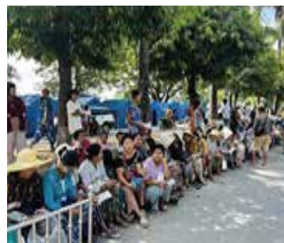
길에서 구호품을 기다리는 천막 난민